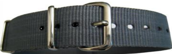
GREY- & SHORT 25.5mm JAN CODE : 4580353200013-18mm JAN CODE : 4580353200082-20mm