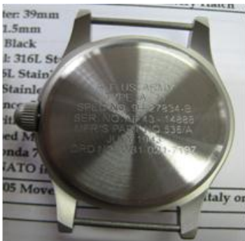
MILSPECS ON CASE BACK