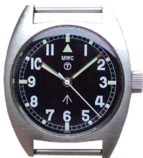
MWCが1974年にローデシア軍に納品したミリタリーウォッチ。