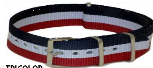
TRICOLOR JAN CODE : 4580353200068-18mm JAN CODE : 4580353200136-20mm