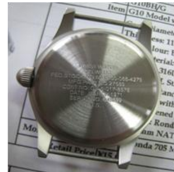
MILSPECS ON CASE BACK