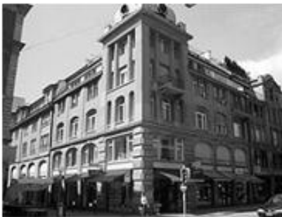
Uraniastrasse 18 CH-8001 Zurich (MWCのスイス・オフィスのあるビル。)

同社はスイスをはじめドイツ、イタリア他複数のサプライヤーとの長年に渡るパートナーシップの下、軍用時計にとって最も重要である信頼性の向上に努めています。