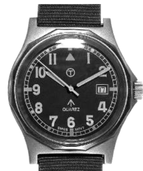
MWC が初めて製作したG10ウォッチ。(1979年)