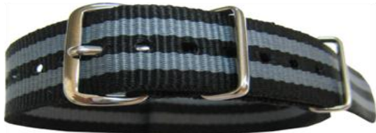
JB GREY-18-20mm & SHORT 25.5mm JAN CODE : 4580353200044-18mm JAN CODE : 4580353200112-20mm