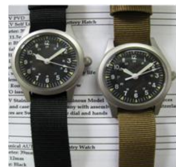
US MILITARY STRAPS

Case Size : 39.9mm(36.0mm Ex. Crown) Thickness ; 11.5mm Lug Size : 18.0mm Lug to Lug : 43mm Water Resistant to 30M/99ft