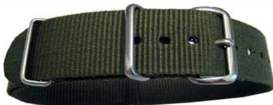
SAGE GREEN JAN CODE : 4580353200020-18mm JAN CODE : 4580353200099-20mm