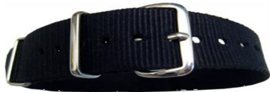
BLACK- & SHORT 25.5mm JAN CODE : 4580353200006-18mm JAN CODE : 4580353200075-20mm