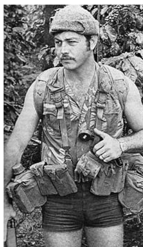
1970年代当時のローデシア軍の兵士。