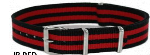
JB RED JAN CODE : 4580353200051-18mm JAN CODE : 4580353200129-20mm