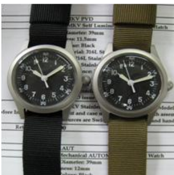
US MILITARY STRAPS